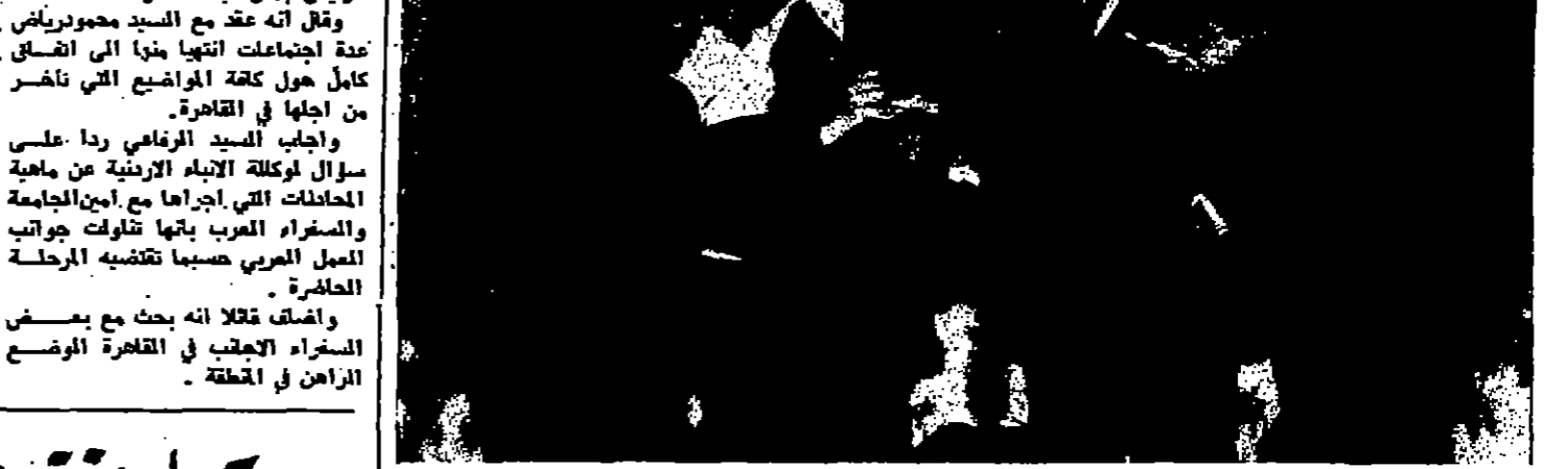
السيد عبد القاسم الرفاعي وزير الدولة للشؤون الخارجية يتحدث إلى الصحفيين في مطار عمان

١٥ ألف أميركي سبعون ألفا من المقاتلين - استمرار التاهب وضع ليجول نيويورك - رويتر - تمكن ستون ألفا من رجال الحرس الوطني والحش من المحافظة على سلام قلق في مدن أميركية مختلفة مزقتها الاضطرابات في وقت خيم فيه هذوع على الأحياء الزنجة خلال الاحتفال ببعثن الدكتور مارتن لوتر كينج .